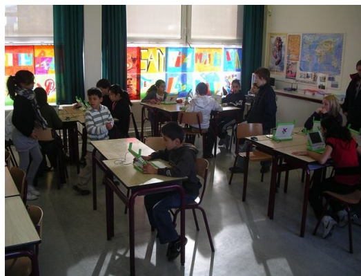
de XO's op Nederlandse scholen

Sinds de start van OLPC 1,5 jaar geleden zijn er 600.000 laptops in 27 verschillende landen ( http://wiki.laptop.org/go/Deployments ) uitgegeven, ook in Westerse landen. De laptop is ook beschikbaar voor de particuliere markt via de actie Give One Get One. Dit houdt in dat voor elke in de westerse wereld verkochte OLPC-laptop een exemplaar wordt uitgereikt in de armste landen. Dit jaar is de XO ook in Nederland verkrijgbaar via de website van OLPC http://laptop.org/xo en voor scholen via www.openwijs.nl