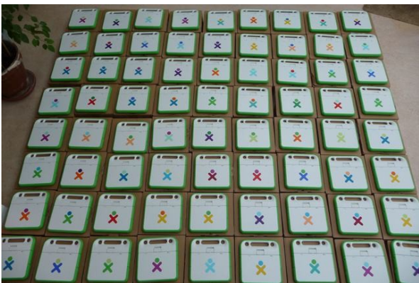
elk kind zijn of haar eigen XO

OLPC (One Laptop Per Child) is een project om de armste kinderen in de wereld meer toegang te geven tot educatie en daarmee betere levensomstandigheden. De kinderen krijgen de mini laptop XO (voorheen de 100$ laptop) die sterk, goedkoop en zuinig is. Deze laptop is voorzien van educatie- en spelmateriaal en heeft netwerktoegang.