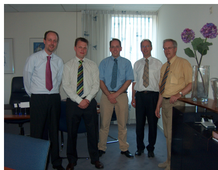
AV-Projectteam A&C en Wartburg

Na de zomervakantie hopen wij (Wartburg College, locatie Guido de Brès) te starten in een nieuw gebouw. Ik heb me de afgelopen maanden nogal intensief beziggehouden met de inrichting van de school op het gebied van Audio-Visuele middelen. Daarbij hebben we door verschillende bedrijven een offerte laten maken voor de totaalinrichting (aula, collegezaal, bestuurskamer, informatiesysteem en lokalen). Uitgangspunt hierbij is geweest dat alles zo eenvoudig mogelijk te bedienen moet zijn.